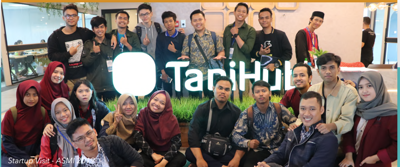
Startup Visit - ASMI 2019

Verifikasi identitas peserta meliputi biodata dan status mahasiswa dengan data PD-DIKTI. Seleksi dilakukan secara online oleh Tim Seleksi yang ditetapkan oleh Direktorat Belmawa, Kemendikbud.